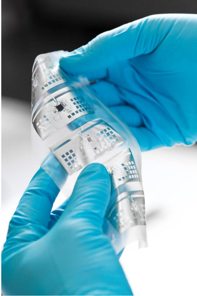
Puettava langaton anturi biosignaalin mittaukseen