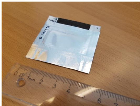
Taipuisa superkondensaattori energiavarastoksi